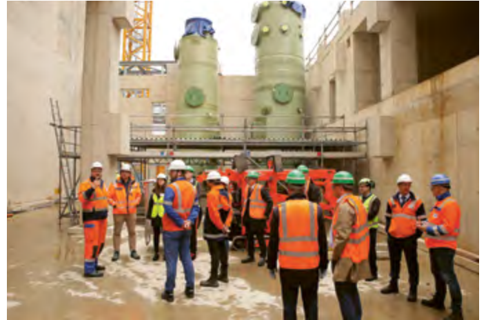
Impressionen der Baustellenbesichtigung in Hürth-Knapsack

Die Klärschlamm-Monoverbrennung in Hürth macht große Fortschritte: Der Rohbau der Ofenhalle steht, der technische Ausbau hat begonnen und erste Komponenten von Ofen und Kessel sind montiert. Damit nimmt eines der wichtigsten Zukunftsprojekte der regionalen Wasserwirtschaft weiter Gestalt an.