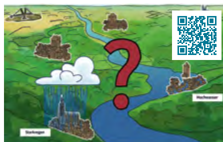
Erklärfilm »Starkregen vs. Hochwasser erklärt«