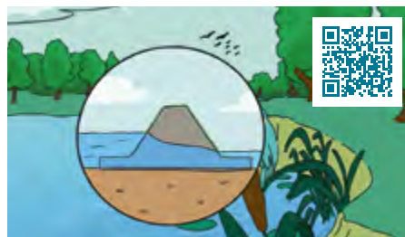
Erklärfilm »Ökologische Gewässerentwicklung trifft Hochwasserschutz«

Fließgewässer sind dynamische Systeme, doch viele haben durch Begradigungen ihre natürliche Vielfalt und überflutbaren Auenräume verloren. Dies ist mit höheren Fließgeschwindigkeiten, weniger Lebensräumen und größerem Hochwasserrisiko verbunden. Naturnahe Auen können dem entgegenwirken: Sie speichern Wasser, senken Abflussspitzen und ermöglichen schadloses Übertreten der Ufer. Der neue Erklärfilm zeigt, wie diese natürlichen Prozesse funktionieren und warum ihre frühzeitige Verzahnung mit technischen Maßnahmen entscheidend ist.